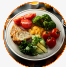
ZACHOWANIE POWTARZALNOŚCI I JAKOŚCI PRZYGOTOWANIA

Prawidłowo skomponowany jadłospis to nie tylko wybór produktów, ale również odpowiednia technologia przygotowania i organizacja pracy kuchni.